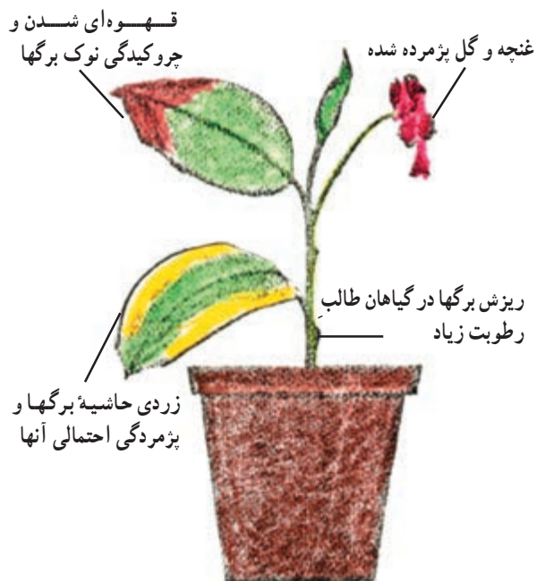
شکل ۱-۵۳ - علایم و خسارات کمبود در رطوبت نسبی هوا بر روی گیاهان آپارتمانی

– پاشیدن آب در هنگام عصر یا شب باعث می‌شود تا آب بر روی گیاه باقی بماند و تبخیر نشود و از تبادلات گیاه با محیط خارج جلوگیری کند.