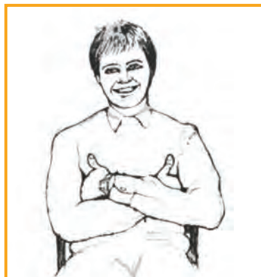
نگرش برتر نسبت به دیگران