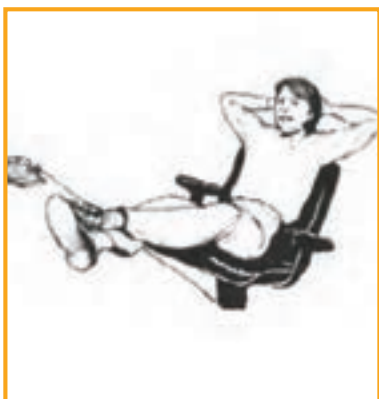
برتری و اعتماد به نفس