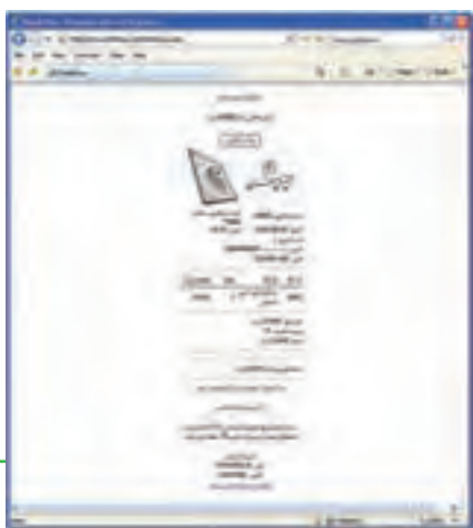
شکل ۲۹-۱۰ دریافت رسید یا فاکتور خرید

۹- پرداخت نقدی: در این روش، فروشگاه از طریق پست کالا را برای خریدار ارسال می کند و خریدار هزینه کالا را به صورت نقدی در هنگام دریافت، به مأمور پست می پردازد. تسویه حساب بین فروشگاه و شرکت پست، مطابق با قرارداد فی مابین انجام خواهد شد. شرکت پست درصدی از هزینه کالا را به عنوان کارمزد یا هزینه تحویل دریافت می نماید.