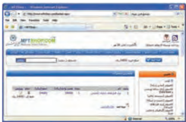
شکل ۱۰-۲۲ مرور سبد خرید