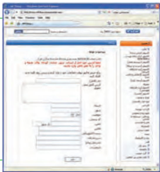
شکل ۲۶-۱ پرداخت از طریق حواله بانکی

۷- پرداخت از طریق حواله بانکی: خریدار در این روش هزینه کالا را به شماره حساب فروشگاه در بانک مربوط واریز کرده و شماره فیش واریزی را در فرم آنلاین وارد می‌نماید. فروشگاه پس از تأیید فرایند خرید، کالا را برای خریدار از طریق پست ارسال می‌کند. هزینه پست هم معمولاً از خریدار به همراه هزینه کالا اخذ می‌گردد.