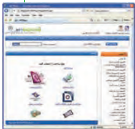
شکل ۱۰-۲۳ انتخاب نحوه پرداخت

۵- انتخاب نحوه پرداخت هزینه کتاب که معمولاً با روش‌های مختلفی انجام می‌شود.