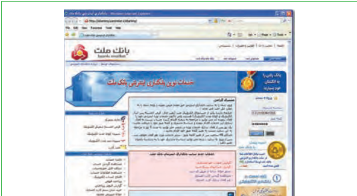
شکل ۲-۱۰ صفحه ورودی بانکداری اینترنتی

۲- ورود به سایت بانکداری اینترنتی و دسترسی به اطلاعات حساب‌ها از طریق شناسه مشتری و کلمه عبور