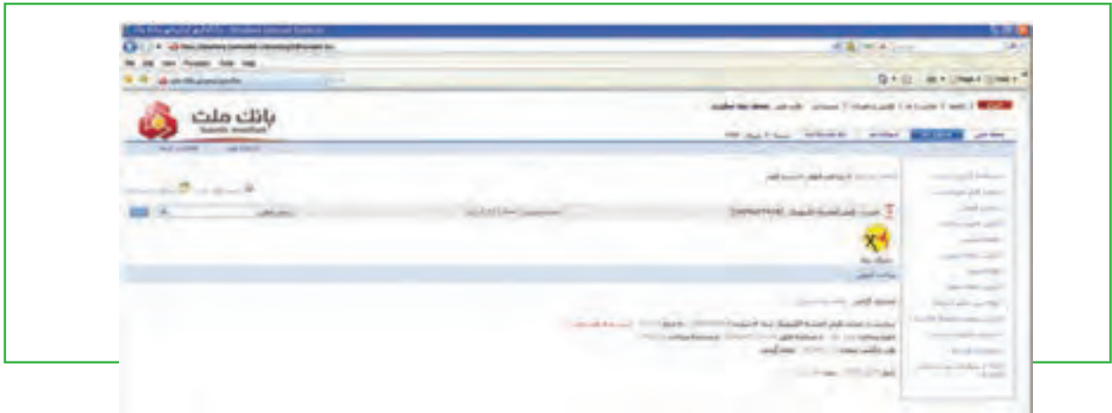
شکل ۷- ۱۰