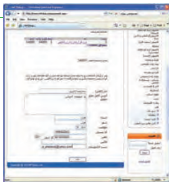
شکل ۲۴-۱ تکمیل فرم آنلاین مشخصات خریدار

۷- پرداخت از طریق حواله بانکی: خریدار در این روش هزینه کالا را به شماره حساب فروشگاه در بانک مربوط واریز کرده و شماره فیش واریزی را در فرم آنلاین وارد می‌نماید. فروشگاه پس از تأیید فرایند خرید، کالا را برای خریدار از طریق پست ارسال می‌کند. هزینه پست هم معمولاً از خریدار به همراه هزینه کالا اخذ می‌گردد.