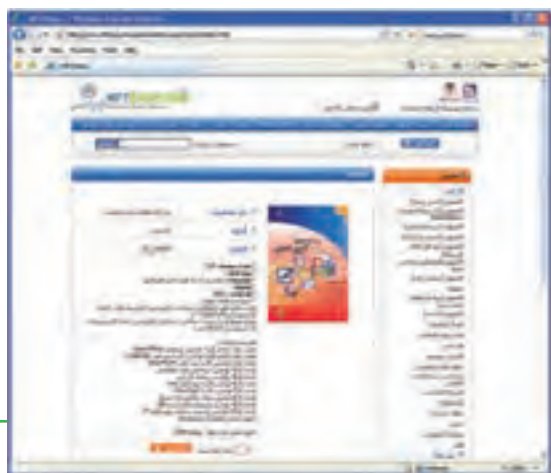
شکل ۱۰-۲۰ مشخصات کتاب انتخابی