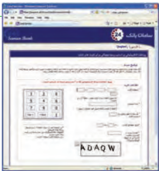
شکل ۲۵-۱ صفحه بانک طرف قرارداد با فروشگاه

۶- پرداخت اینترنتی: این روش معمول‌ترین روش پرداخت در خریدهای اینترنتی است. در این روش خریدار پس از انتخاب، به صفحه پرداخت در بانک طرف قرارداد با فروشگاه هدایت شده و با وارد نمودن اطلاعات حساب خود، مبلغ هزینه کالا را به حساب فروشگاه واریز می‌نماید. در حقیقت مبلغ از حساب خریدار کسر و به حساب فروشنده اضافه می‌شود.