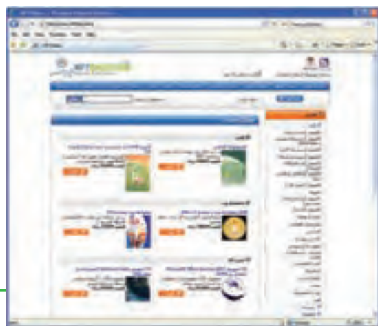
شکل ۱۰-۱۹ فروشگاه اینترنتی مجتمع فنی تهران

۳- اضافه کردن کتاب (یا کالا) به سبد خرید شکل (۱۰-۲۱)