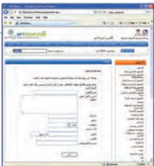
شکل ۲۷-۱۰ پرداخت در محل

۸- پرداخت در محل: این روش در شهر محل اصلی فروشگاه مجازی یا شهرهای دارای شعبه کاربرد دارد. تحویل کالا به خریدار به جای مأمور پست، از طریق پیک فروشگاه انجام می شود و هزینه هم به او پرداخت می شود.