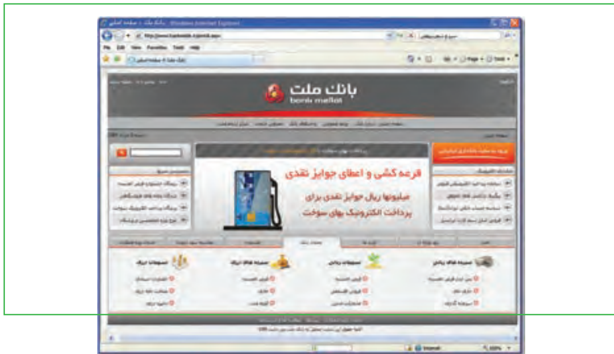
شکل ۱-۱ صفحه ورودی سایت بانک ملت

به منظور پرداخت قبوض از بستر اینترنت، مشتریان می توانند با مراجعه به سایت بانک ملت به نشانی www.bank.mellat.ir و انتخاب گزینه ورود به سایت بانکداری اینترنتی، با استفاده از شناسه مشتری و رمز عبور به صفحه بانک اینترنتی خود وارد شوند، از آنجایی که برخی از مشتریان بیش از یک حساب متمرکز در اختیار دارند بایستی حساب مورد نظر خود را جهت پرداخت قبض تعیین و سپس با استفاده از منوی فعالیت ها نسبت به انتخاب گزینه پرداخت قبوض اقدام نموده و با کلیک بر روی گزینه اجرا وارد صفحه پرداخت قبوض گردند. در صفحه پرداخت قبوض بایستی اطلاعات قبض در محل های مورد نظر (شناسه های قبض و پرداخت و مبلغ) درج و با انتخاب گزینه تأیید نسبت به پرداخت قبض اقدام شود، لازم به ذکر است پس از انجام مراحل فوق سامانه نسبت به تولید رسید قابل چاپ اقدام خواهد نمود. ۱- ورود به سایت اینترنتی بانک ملت