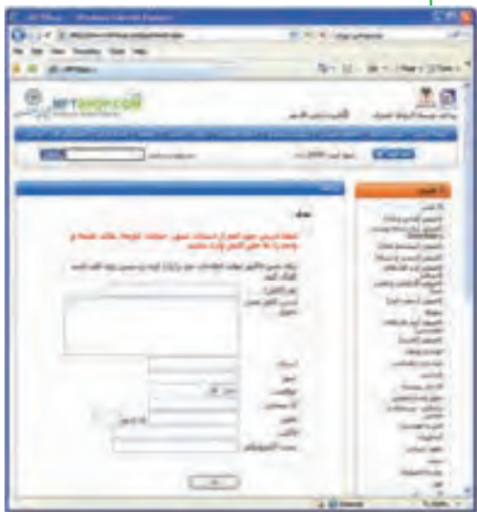
شکل ۲۸-۱۰ پرداخت نقدی

۸- پرداخت در محل: این روش در شهر محل اصلی فروشگاه مجازی یا شهرهای دارای شعبه کاربرد دارد. تحویل کالا به خریدار به جای مأمور پست، از طریق پیک فروشگاه انجام می شود و هزینه هم به او پرداخت می شود.