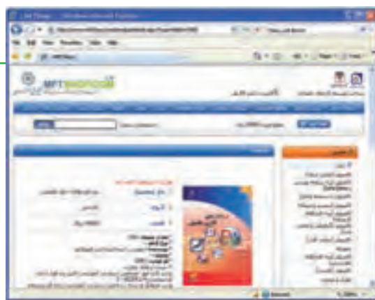
شکل ۱۰-۲۱ اضافه کردن به سبد خرید

۵- انتخاب نحوه پرداخت هزینه کتاب که معمولاً با روش‌های مختلفی انجام می‌شود.